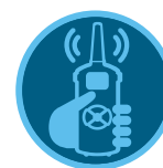
Pilot ROAM Strona 146 Pilot ROAM XL Strona 147