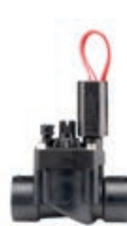
PGV-101/101 Średnica wlotu: 1" (25 mm) Wysokość: 13 cm Długość: 11 cm Szerokość: 6 cm