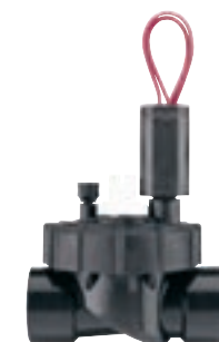
PGV-100JT - G Średnica wlotu: 1" (25 mm) Wysokość: 14 cm Długość: 11 cm Szerokość: 8 cm