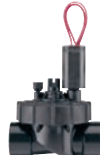
PGV-101JT-G Średnica wlotu: 1" (25 mm) Wysokość: 14 cm Długość: 11 cm Szerokość: 8 cm