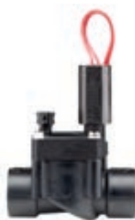
PGV-100/101 Średnica wlotu: 1" (25 mm) Wysokość: 13 cm Długość: 11 cm Szerokość: 6 cm

* Informacje dotyczące Accu-Sync znajdują się na stronie 94