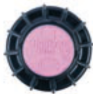
PGJ do wody zreaktywowanej

Dostępny jako opcja instalowana fabrycznie we wszystkich modelach