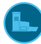
Czujnik Rain-Clik Strona 144