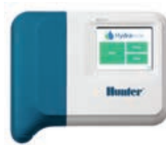
HC (plastikowa, wewnętrzna) Wysokość: 15,2 cm Szerokość: 17,8 cm Głębokość: 3,3 cm